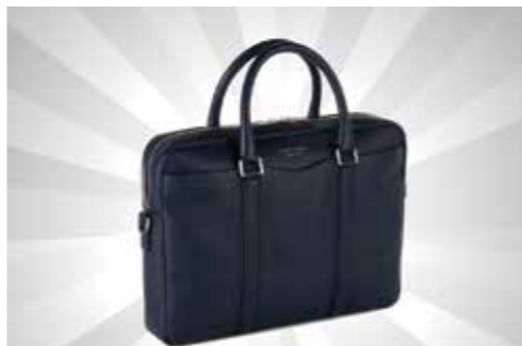
Koper Signature S Doc S$1,307.48 dari BOSS