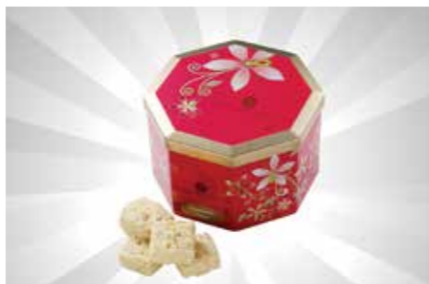
Macadamia Sugee Cookies 380g S$21.80 dari Bengawan Solo