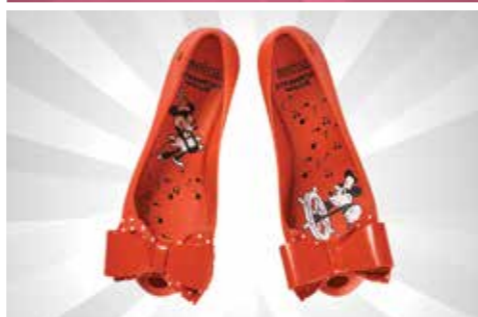
Sepatu Flat Melissa Ultragirl + Minnie Mouse IV Ad S$130.84 dari The Fashion Gallery