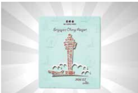
Mini EZ Chicken (Seri Singapura) 230g S$17.57 dari Bee Cheng Hiang