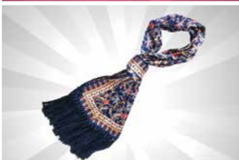
Selendang Batik S$139 dari Discover Singapore