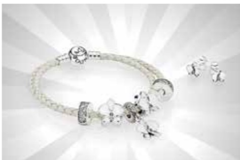
Set Gelang + Anting-anting menawan S$471 (Gelang), S$64.48 (Anting-anting) dari Pandora

Semua harga benar pada saat pencetakan. Harga dalam Dolar Singapura (S$), belum termasuk PPN. Item yang ditunjukkan tergantung ketersediaan stok.