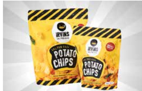
KripiK Kentang Rasa Telur Asin S$15 (besar), S$7.50 (kecil) dari IRVINS Salted Egg