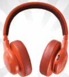
JBL - On-Ear Headphones Seri E Nirkabel S$204 dari Cameras Electronics Computers by Sprint-Cass