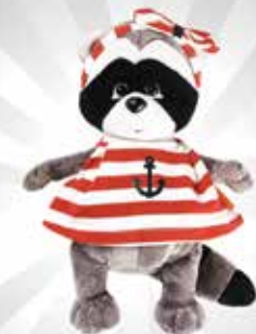
Mainan Plush Orange Toy Art S$36.90 dari Avenue Kids

Semua harga benar pada saat pencetakan. Harga dalam Dolar Singapura (S$), belum termasuk PPN. Item yang ditunjukkan tergantung ketersediaan stok.