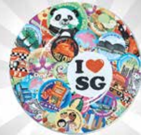
Piring I Love SG 8.5" S$16.90 dari Discover Singapore