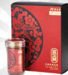
Supreme Ruby Bird's Nest Rock Sugar 150g S$176.64 dari Eu Yan Sang