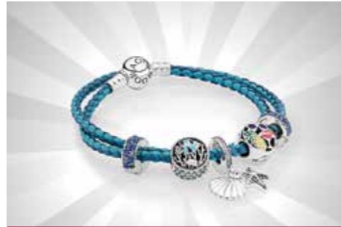
Charmed Bracelet S$517.75 dari Pandora