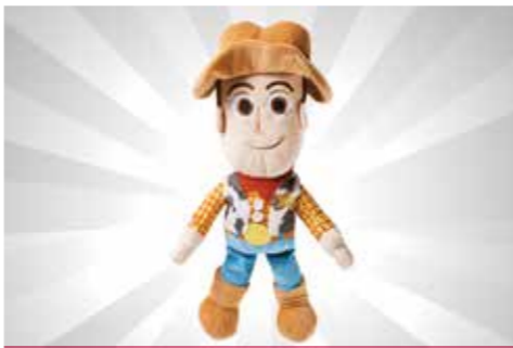
Mainan Plush Toy Story Woody S$37.29 dari Kaboom