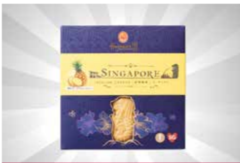
Pineapple Flavoured Cookies S$16.82 dari Fragrance Bak Kwa

Semua harga benar pada saat pencetakan. Harga dalam Dolar Singapura ($S), belum termasuk PPN. Item yang ditunjukkan tergantung ketersediaan stok.