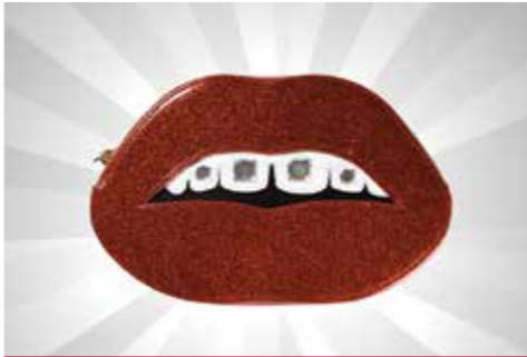
Tas Makeup Tatty Devine Dental Bling S$53.15 dari Monoyono