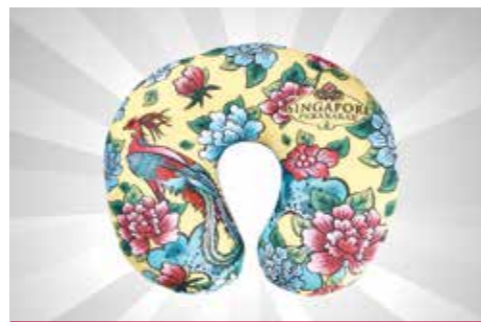
Bantal Leher Peranakan S$19.90 (harga promo) dari Discover Singapore